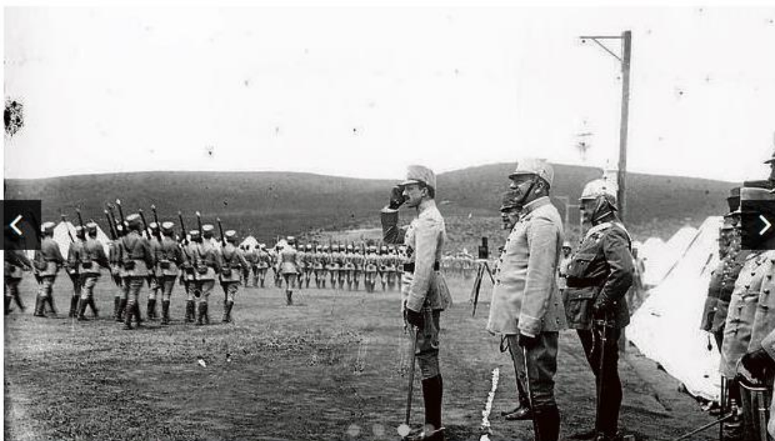
Desfile ante el monarca