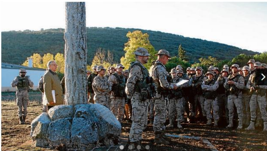
Homenaje ante el monumento a Alfonso XIII rendido por alumnos de la Academia de Infantería - J.L.I

» Hace un siglo, alumnos de la Academia de Infantería que hacían maniobras en Los Yébenes se vieron sorprendidos por la presencia de Alfonso XIII