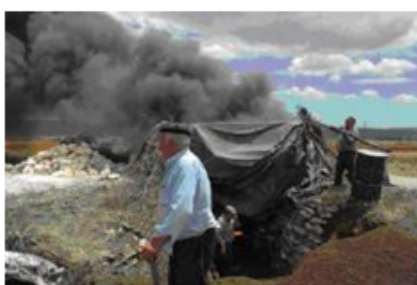
Imágenes recuperadas que podrían estar sacadas del recuerdo

El acto central del 'Día del Calero' girará en torno a la "quema" de un horno, a las siete de la mañana de hoy sábado, 7 de junio, y se prolongará hasta la noche, ya que la cochura de la piedra caliza requiere de unas 14 horas a una temperatura que llega a alcanzar los 1.800 grados centígrados, informó en nota de prensa la asociación.