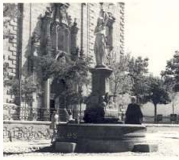
El Caño. Plaza Mayor de Orgaz. Año 1960

En el año 1852 el Ayuntamiento de Orgaz tomó el acuerdo de poner una fuente pública en la Plaza Mayor, para suministrar agua potable a la población, que hasta entonces se abastecía de los pozos existentes en las casas y en los alrededores, siendo el agua escasa y de mala calidad, tal como se lee en el referido acuerdo: "Que es absolutamente necesario ya para la salud pública, ya para la comodidad del vecindario, la construcción de una Fuente que surta de aguas potables a estos vecinos Que en atención a que las de que se hace uso por este Común son de pozos, y estos, no obstante al excesivo cuidado de su limpieza, es imposible tenerlos con el debido aseo, por infiltrarse en ellos las aguas llovidas y corromperse algunas veces por las procedentes de nubes, se proceda a la erección de la insinuada fuente ..." El agua se trajo del lado del norte de la Villa, "por estar a mucho más altura el terreno que el pueblo, y tan somera que en su superficie y a poca distancia se hallan de buena calidad y en abundancia". Se excavó un pozo junto al paseo de El Socorro, a la izquierda según se sube, muy cerca de la ermita, y se construyeron las conducciones necesarias.